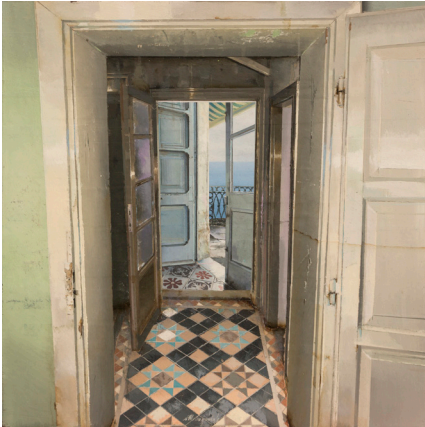
La Porta Azzurra 2017 Oil and Mixed Media on Board 40 x 40 cm (16 x 16 in)