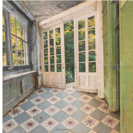
La Vetrata Bianca 2017 Oil and Mixed Media on Board 30 x 30 cm (12 x 12 in)