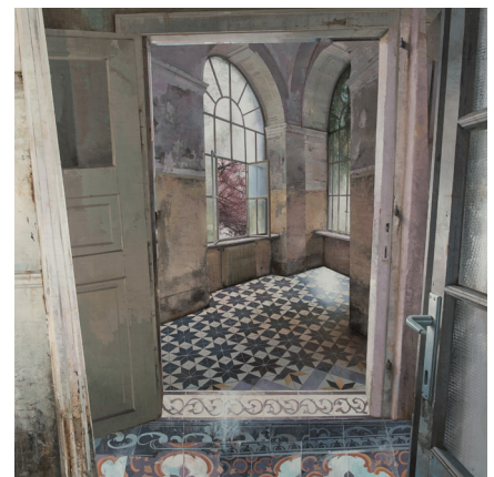
Room at the Corner 2016 Oil and Mixed Media on Board 150 x 150 cm (59 x 59 in)

A tension plays out in these outwardly calm and controlled images. The subject, a point in time and space, is elusive, constantly changing and sitting on the edge of perception. Massagrando's careful rendering of his systematic and forensic observations makes paintings of rich visual density, which effectively capture and pin down a significant moment within his rigorous method.